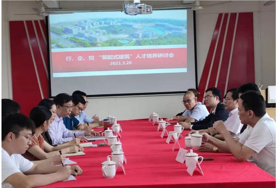
图 4：装配式建筑人才培养研讨会

4、广东永和建设集团有限公司共建装配式实训室合同（包含装配式建筑实训基地设备）。